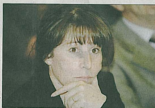
Fadela Amara en appelle à la mobilisation générale pour aider les jeunes.

"Talents des cités" est le symbole que tout est possible dans ces quartiers quand des hommes et des femmes tendent la main pour faire émerger de belles idées", se félicite Fadela Amara. Une satisfaction qui n'en efface pas pour autant les difficultés rencontrées par les jeunes pour aller au bout de leurs rêves. "Dans les cités, qui sont un vivier inépuisable de talents, il est plus qu'ailleurs difficile de s'en sortir, alors les jeunes sont tenaces. Ils ne lâchent pas le morceau." La secrétaire d'État à la ville